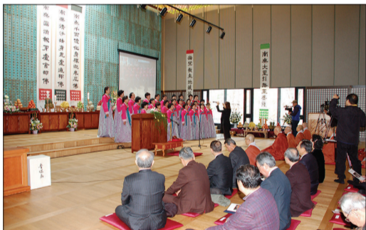
축기를 부르는 금강선원 가가합창단