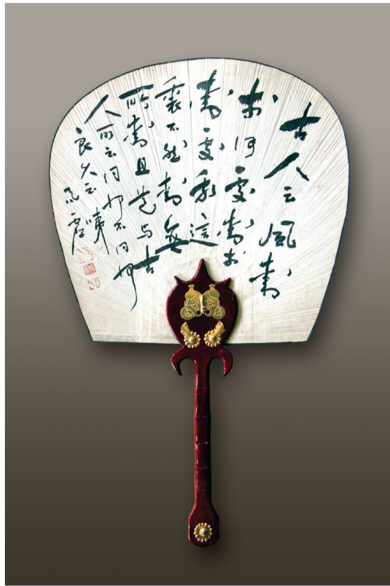
500 x 800mm