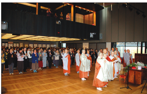
정성을 다한 수륙대재를 마치며