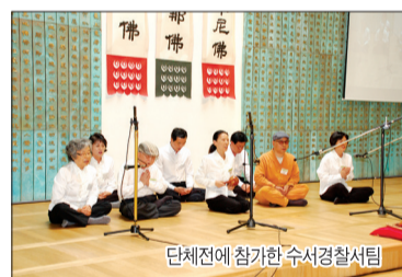
단체전에 참가한 수서경찰서팀