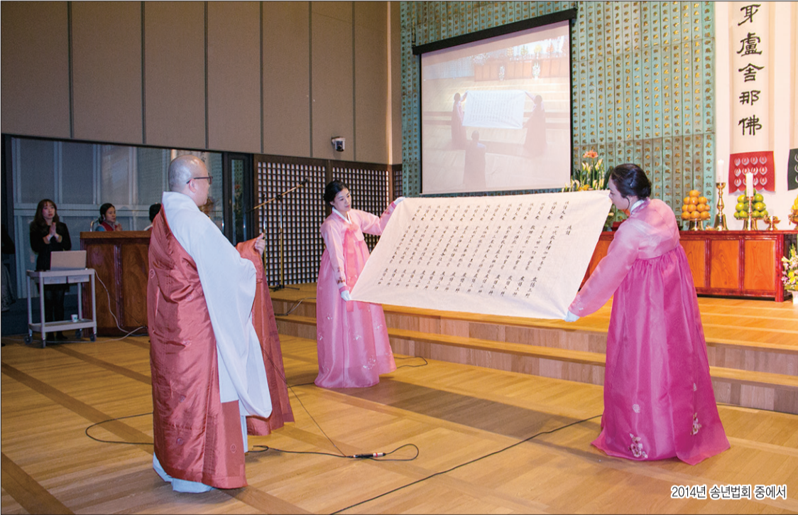
2014년 송년법회 중에서

발행처 : 대한불교조계종 금강선원 / 발행인 : 헤거스님(안동수) / 발행소 : 서울특별시 강남구 개포로82길 11 삼우빌딩 405호(135-243) / 편집 : 금강선원 편집부 / TEL : 445-8484 FAX : 445-8043 / 등록번호 : 서울라-10888