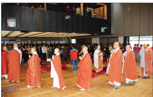
수륙대재에 앞서 진행된 순당의례